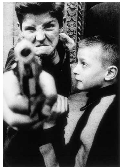
Gun I, New-York, 1955 - William Klein Photographie argentique Collection de l'artothèque de Vitré Communauté